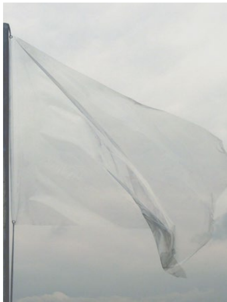
Edith Dekyndt, One second of silence (part 1, New York) (détail), 2008. Vidéo non sonore, 18 min 32, Collection 49 Nord 6 Est – Frac Lorraine, Metz © Edith Dekyndt.

Pour son exposition au CCCOD, Dieudonné Cartier prolonge cette relation entre art et science, techniques scientifiques et processus de création, mathématiques et abstraction. Abordant l'exposition comme un laboratoire, il développe un projet inédit qui explore la question très contemporaine des datas et du flux de données numériques. L'eau de la Loire est ici envisagée comme la matière première et vivante de ses recherches.