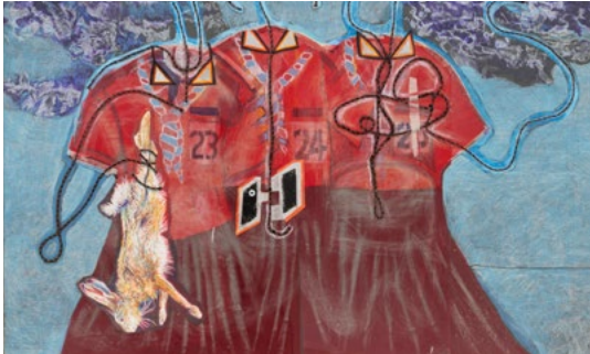
Anna Solal, Les trois scouts (détail), 2023, peinture, dessin, cadre en bois