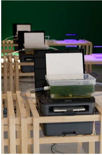
Dieudonné Cartier, vue de l'exposition Fragment 91 , CCCOD - Tours, 2024.