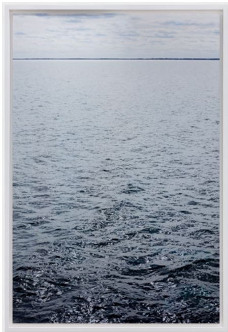
Wolfgang Tillmans, Nova , 2015, impression jet d'encre monté sur Dibond, 211 x 145 x 6 cm, courtesy de l'artiste et de la galerie.

site Internet de l'artiste : www.anavidigal.com