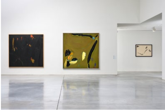
Olivier Debré. La figuration à l'envers , vue d'exposition au CCCOD, Tours, France, avril 2023