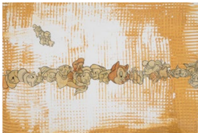
Ana Vidigal, Intimidade casual , 2022, techniques mixtes, 85 x 100 cm.