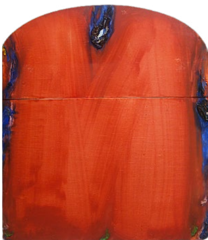
Olivier Debré, sans titre (maquette pour le rideau de scène de la Comédie-Française 1) , 1987, huile sur toile montée sur panneau de contreplaqué, 114,5 x 100 cm, Collection particulière, France.

4 | 4 avril - 2 novembre 2025 | vernissage le 3 avril 2025 exposition personnelle