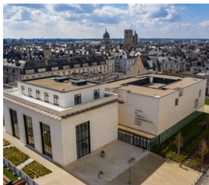
le bâtiment du CCCOD par l'agence Aires Mateus

En plein cœur historique à quelques pas de la Loire, le centre d'art contemporain de Tours s'est installé depuis 2017 dans un nouveau bâtiment conçu par les architectes Aires Mateus .