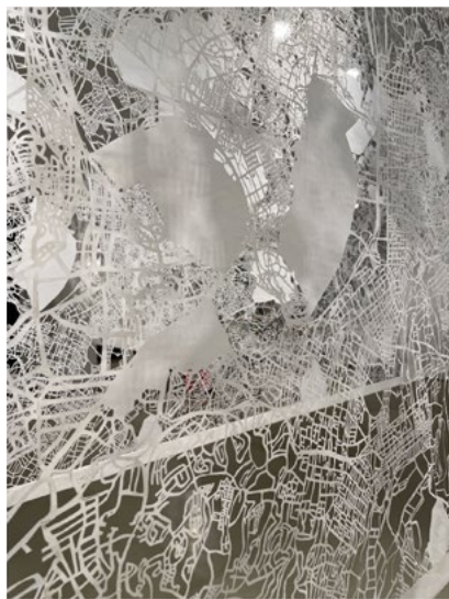
Elisabetta Di Maggio, Mapping the Air , 2007/2022, Tissue paper hand-cut with scalpel.