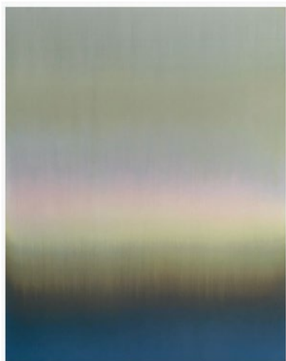
Claire Chesnier, 030623, 2023, 172 x 137 cm.

6 | 6 juin 2025 - 18 janvier 2026 | vernissage le 5 juin 2025 exposition personnelle