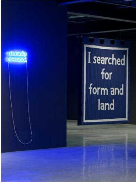
vue d'exposition Sortir le travail de sa nuit