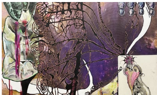
Pierre Unal-Brunet, FROST&POUND (détail), 2022, toile de jute sur châssis en aluminium, encre, acrylique, gesso, impressions jet d'encre, papier recyclé, bindex, peinture aérosol, pigments, guanine, 120 x 170 cm, courtesy de l'artiste.

Souvent d'apparence archétypale voire archaïque, les œuvres constituent une sorte de bestiaire folklorique inconnu qui remet en jeu l'ordre des choses. Contaminant l'espace d'exposition comme un corps en expansion, ces œuvres sont des lieux d'intercession entre soi et l'autre, entre le réel et les chimères.