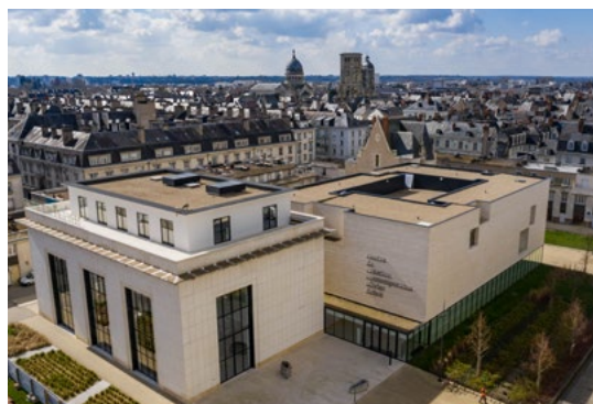
le bâtiment du CCCOD par l'agence Aires Mateus © air2d3

En plein cœur historique de Tours à quelques pas de la Loire, le centre d'art contemporain de Tours s'est installé depuis 2017 dans un nouveau bâtiment conçu par les architectes Aires Mateus .