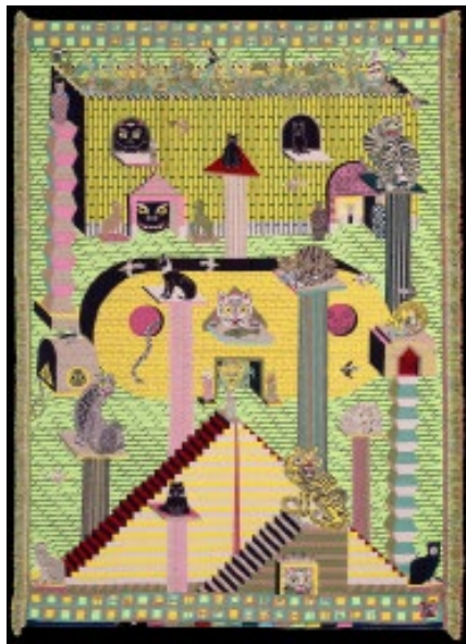
Koen Taselaar, The Age-Old Question Of What Came Before, The Cat House Or The Architect , 2019, tapisserie, tissage Jacquard, 235 x 170 cm.

site Internet de l'artiste : koentaselaar.nl