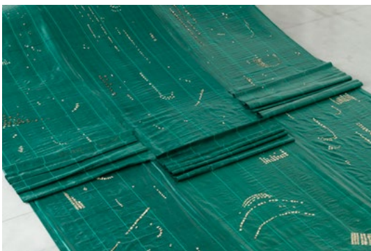
Hera Büyüktaşçıyan « Défendre les eaux ancestrales » vue d'exposition, CCC OD - Tours, France. Courtoisie de l'artiste. © Photo(s) : Aurélien Mole

promotion du travail : la promotion économique du travail comme nom de l'activité humaine fondamentale, mais aussi la lutte des prolétaires pour sortir le travail de sa nuit – de son exclusion de la visibilité et de la parole communes. » in Le Partage du sensible. Esthétique et politique , Paris, La Fabrique, 2000, p.72.