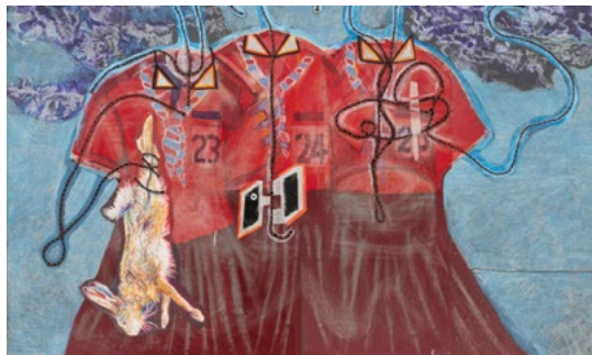
Anna Solal, Les trois scouts (détail), 2023, peinture, dessin, cadre en bois, courtesy de l'artiste et de Mamoth, Londres © Mamoth, Londres