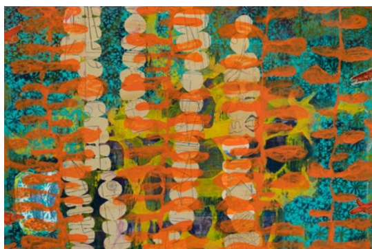
Ana Vidigal, Nada é tão antigo como o passado recente , 2021, techniques mixtes sur toile, 163 x 195 cm.

sites Internet des artistes : www.annasolal.com | instagram.com/hal_bru