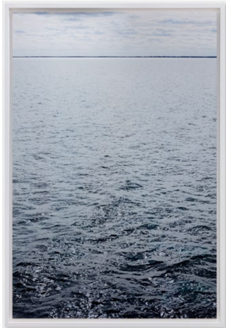
Wolfgang Tillmans, Nova , 2015, impression jet d'encre monté sur Dibond, 211 x 145 x 6 cm, courtesy de l'artiste et de la galerie.

commissariat : Isabelle Reiher & Chiara Bertola