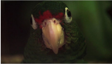
Allora & Calzadilla, The Great Silence , 2014, vidéo, channel HD video installation, 16 mn, 32 secondes. Courtoisie de l'artiste et galerie Chantal Crousel, Paris.

Allora & Calzadilla, le duo d'artistes formé par Jennifer Allora, née en 1974 à Philadelphie, et Guillermo Calzadilla, né en 1971 à La Havane, développe une pratique politisée qui englobe divers médiums et formes, dont la sculpture, la performance, le son, la photographie et la vidéo. Ils se sont rencontrés en 1995 pendant leurs études artistiques à Florence, et aujourd'hui vivent et travaillent à Porto Rico.