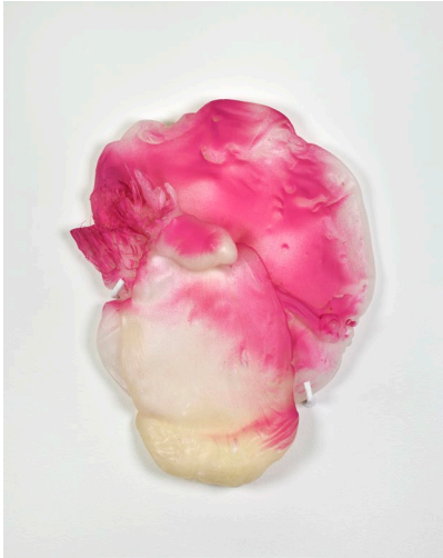
Anita Molinero, « Sans titre », 2019 Polypropylène et peinture acrylique en spray

avec : allora & calzadilla, francesco gennari, romain grateau, anita molinero et stéphanie saadé