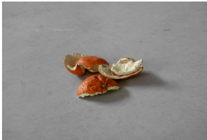
Francesco Gennari Non sarà mai più come la prima volta , 2018 peinture à l'huile sur bronze, cire Dimensions variables selon le subconscient de celui qui l'installe l'oeuvre. Collection Laurent Fievet / Fonds de dotation Kervahut

Francesco Gennari est un artiste italien né en 1973 à Pesaro. Autodidacte, c'est après avoir abandonné ses études de droit qu'il entame sa carrière artistique, d'abord dans sa ville natale et par la suite à Milan. Ses compositions sculpturales privilégient des formes minimalistes dont la simplicité apparente s'avère souvent trompeuse, puisque son œuvre est empreinte d'une réflexion métaphysique, rejetant le simple aspect extérieur de la matière pour en retrouver l'essence. Au sein de sa production, des gestes et des agencements épurés se réalisent ainsi dans des matériaux évocateurs lourds de symbolisme, au service des images qui interrogent la nature éphémère de l'existence.