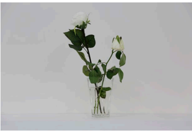
« Faux-jumeaux », 2014

Rose blanche naturelle, rose blanche artificielle, vase en verre, eau.